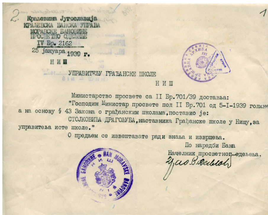
Допис министарства просвете о постављању управитеља школе 25. јануар 1939.

Градско поглаварство обећавало је своју помоћ и благонаклоност, али из техничких и материјалних разлога није дошло до подизања зграде. Остали рад "Заједнице дома и школе" састојао се у узајамном саветовању са наставницима око васпитања школског подмлатка.